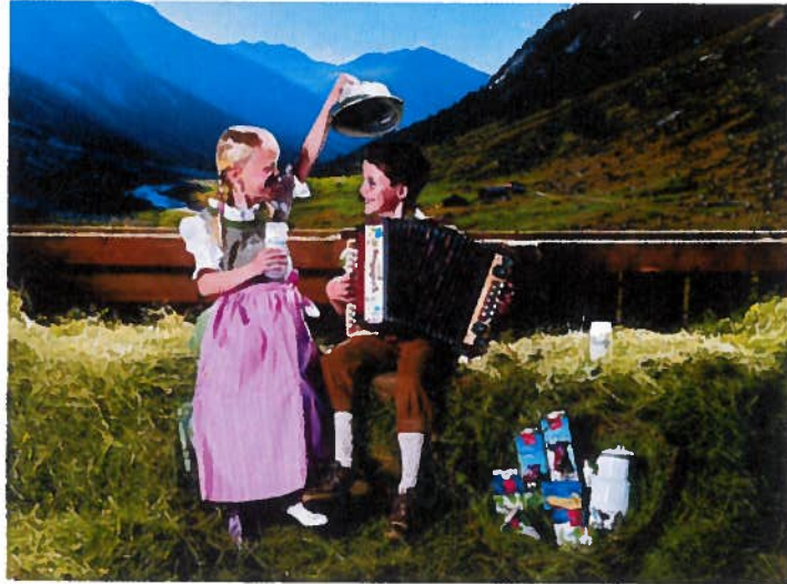
Beim großen Milchfest der Pinzgau Milch und der regionalen Bauernschaft kommen auch die kleinen Besucher voll auf ihre Kosten.

Nur noch zehn Tage, dann geht am Betriebsgelände der Pinzgau Milch das große Milchfest über die Bühne. Die Molkerei in Maishofen und die Pinzgauer Bauernschaft wollen mit der Veranstaltung ihre gelebte Regionalität einer breiten Öffentlichkeit zugänglich machen. Am 4. Juni erwartet die Festbesucher eine Auswahl bester Pinzgau Milch-Produkte und regionaler Schmankerln, ein buntes Programm für Groß und Klein sowie jede Menge Pinzgauer Tradition und Live-Musik.