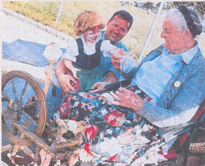
Das Spinnrad kennen die meisten Kinder nur mehr aus dem Märchen.

Die „Pinzgau Milch“ lud zur großen Feier